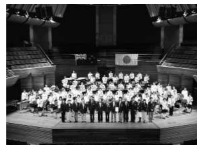
ウエリントン・ジャパンフェスティバル (2001年8月)