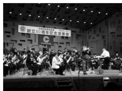
兵庫県吹奏楽連盟創立80周年記念演奏会 （2015年2月）