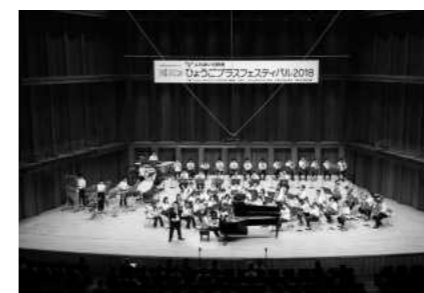
ひょうごプラスフェスティバル2018 （2018年9月）