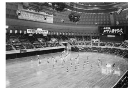
第1回全日本マーチングフェス (1988年11月)