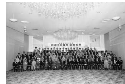
兵庫県吹奏楽連盟創立60周年記念式典 (1994年10月)