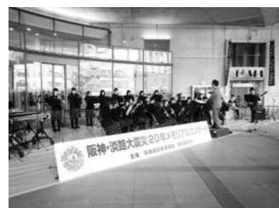
阪神淡路大震災20年 メモリアルコンサート（2015年1月）