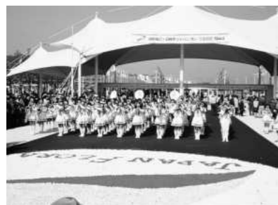
ジャパンフローラ (2000年8月)