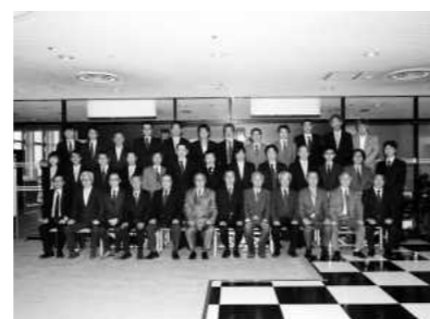
兵庫県吹奏楽連盟通常総会 （2016年4月）