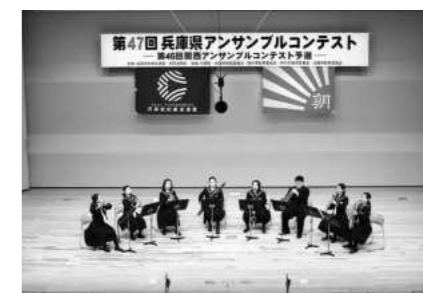
兵庫県アンサンブルコンテスト （2020年1月）