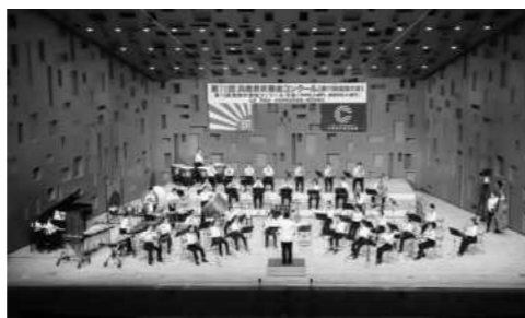
兵庫県吹奏楽コンクール (2023年8月)