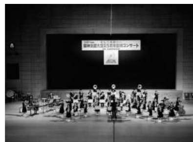
阪神淡路大震災5周年復興コンサート (2000年1月)