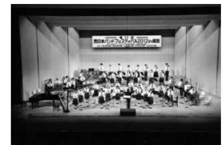
西日本バンドフェスティバル (2012年9月)