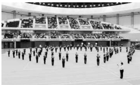
兵庫県マーチングコンテスト (2022年9月)